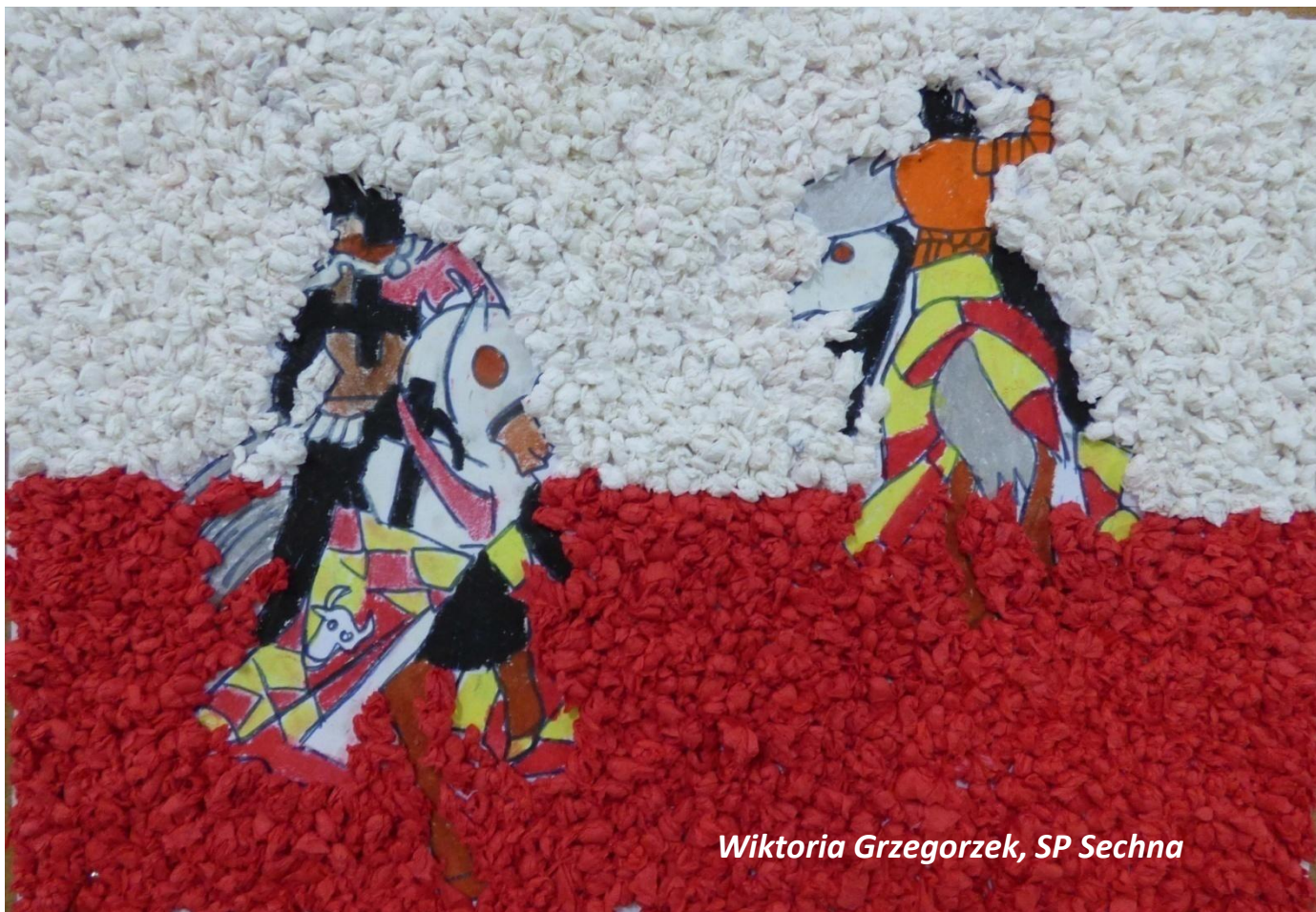
Wiktoria Grzegorzek, SP Sechna

A oto scena, co świadczy o tym, jakie Krzyżakom sprawiał kłopoty, nasz król Władysław - co pod Grunwaldem - zmiótł z pola walki ich pyszną armię!