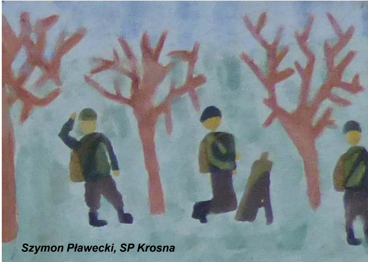
Szymon Pławecki, SP Krosna

Aby potomni też wiedzę mieli, o tych, co krew za Ojczyznę przelali.