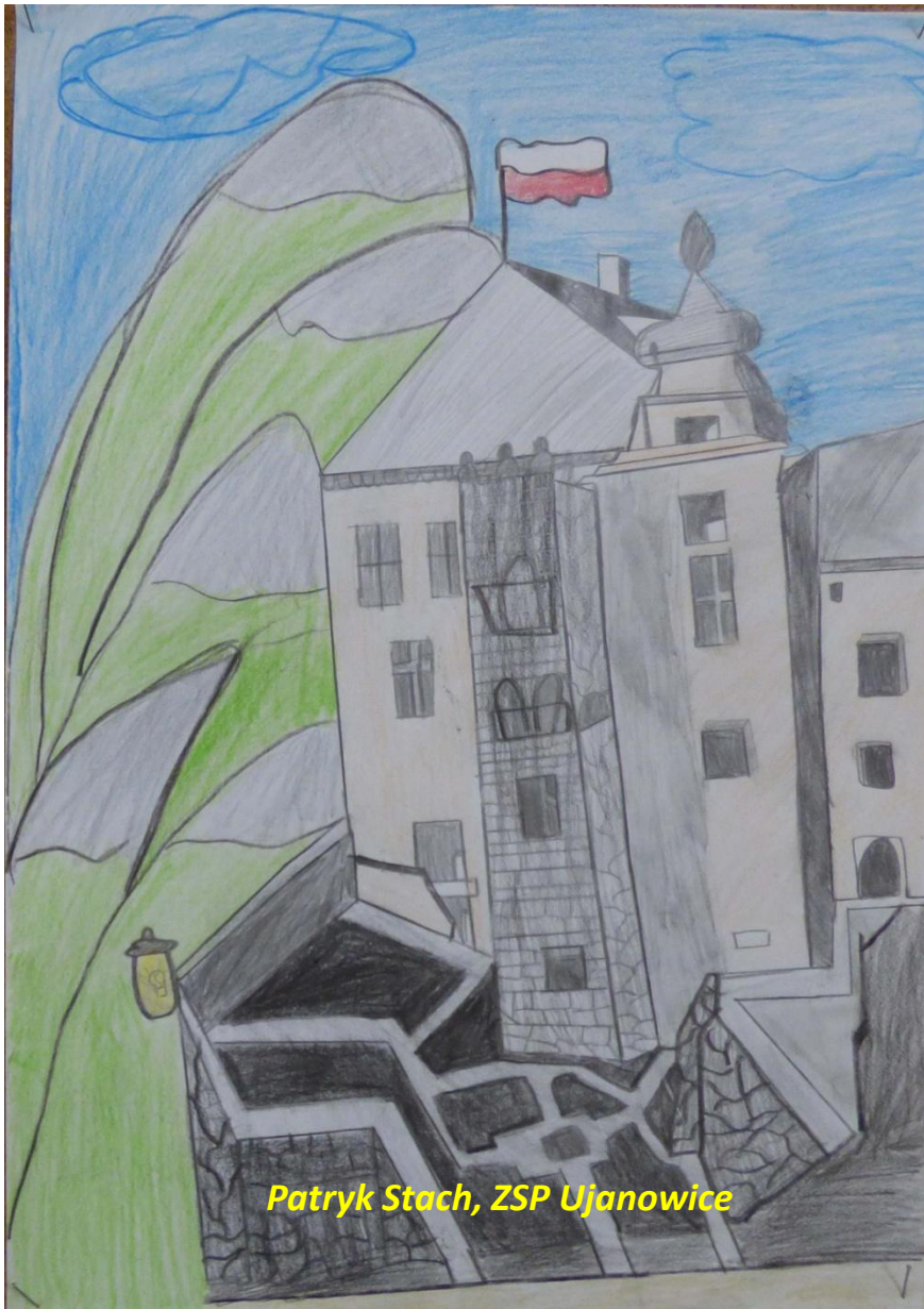
Patryk Stach, ZSP Ujanowice